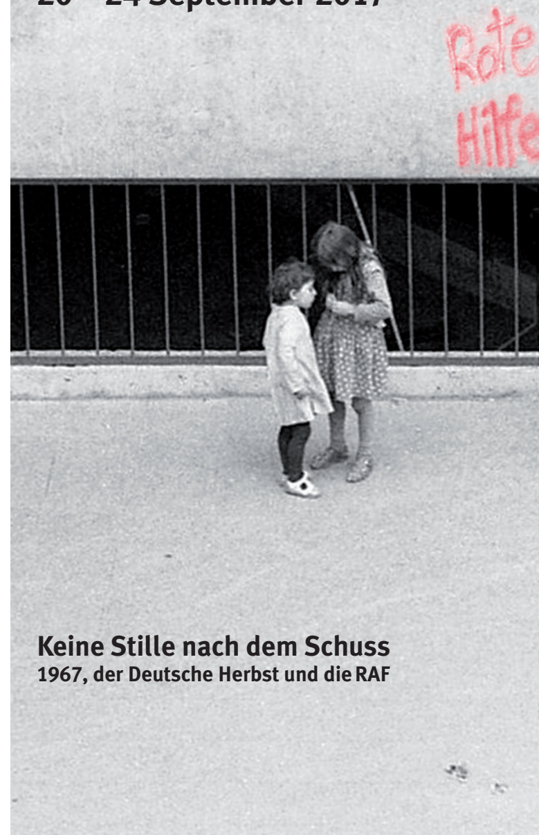
Keine Stille nach dem Schuss 1967, der Deutsche Herbst und die RAF

Festival des historischen Films Potsdam 20 – 24 September 2017